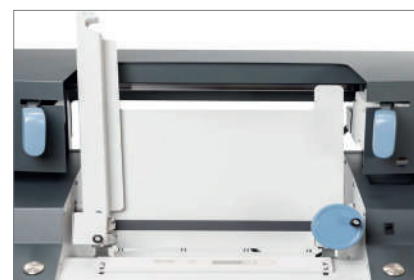
Nuovo sistema Sesame per un semplice bloccaggio del libro

Informazioni aggiornate a giugno 2024 e soggette a modifiche senza preavviso