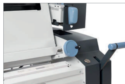
Leve e comandi semplificati, sviluppati per garantire una qualità sempre costante