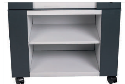
Base di appoggio opzionale