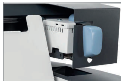
Progettata per la massima sicurezza dell'operatore